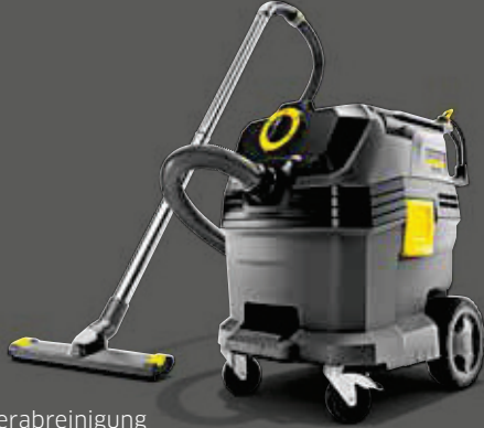
NT 30/1 Tact Te Adv L

mit Steckdose für Elektrowerkzeug und kompletter Antistatikausstattung